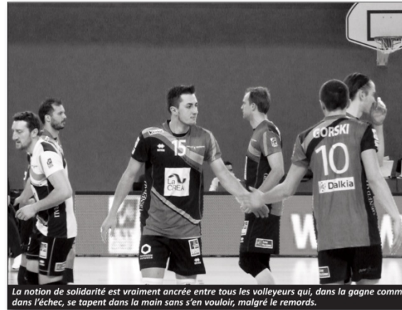
La notion de solidarité est vraiment ancrée entre tous les volleyeurs qui, dans la gagne comme dans l'échec, se tapent dans la main sans s'en vouloir, malgré le remords.

Ah, j'allais oublier une autre qualité remarquable au cours de cette soirée : le fair-play, même en cas de contestation d'une décision arbitrale contraire à la première impression des joueurs. A l'issue de la rencontre, les dirigeants du club local nous ont invités à lever le verre de l'amitié avec eux et les joueurs. Souhaitons que le club obtienne le soutien financier qu'il espère pour lui permettre d'accéder à la Pro A puisque celle-ci lui est destinée.