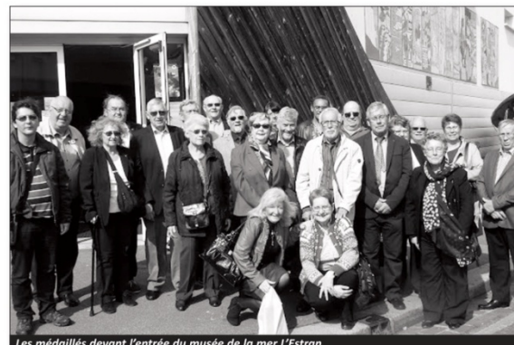
Les médaillés devant l'entrée du musée de la mer l'Estran